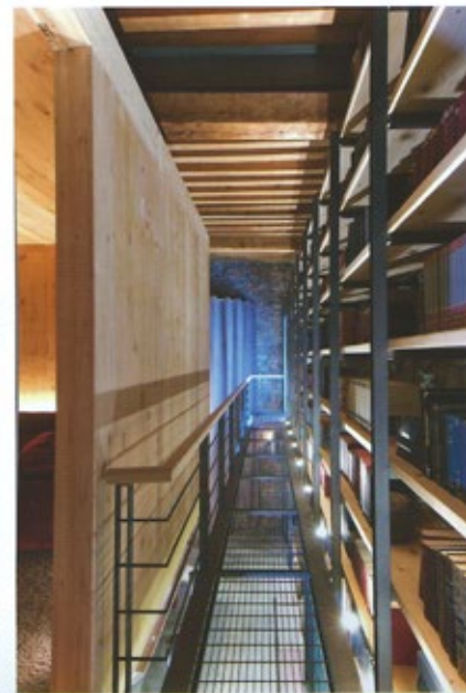
Nombre del Proyecto: Salón de Juegos Proyecto y Obra: WEBER ARQUITECTOS Autor: Fernando Weber / Anina Schulte-Trux Diseño de Mobiliario: Anina Schulte-Trux Colaboradores: Maximiliano Lazo de la Haza, Cecilia Lazo de Lurdes, Gerardo Vázquez Ubicación: Pachuca, Hidalgo, México M2 Construidos: 88 m2 Año de Construcción: 2012 Año de Terminación: 2012 Fotografía: Alfonso de Béjar