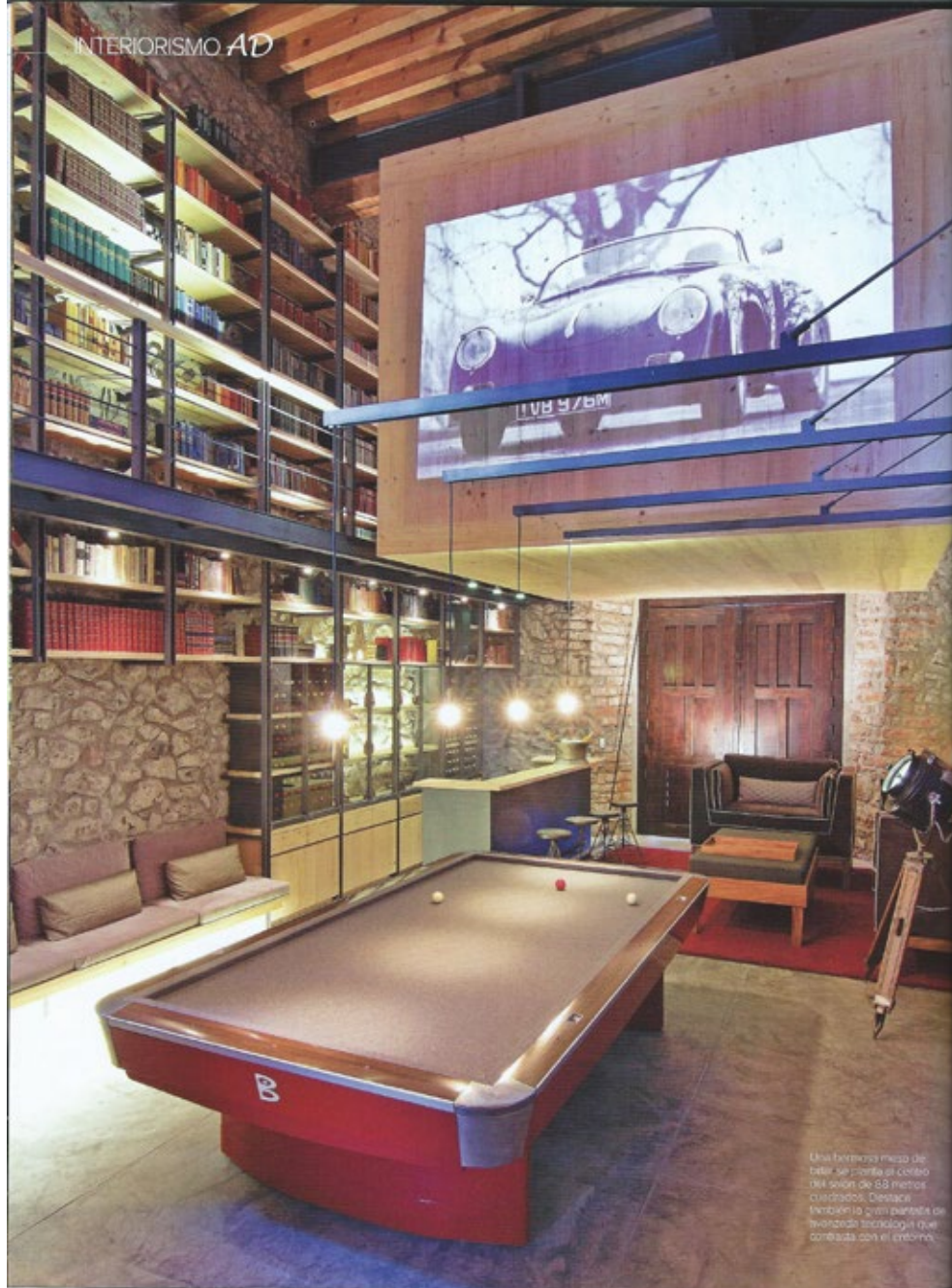
Una hermosa mesa de billar se proyecta al centro del salón de 60 metros cuadrados. Destaca también la gran pantalla de avanzada tecnología que combate con el entorno.